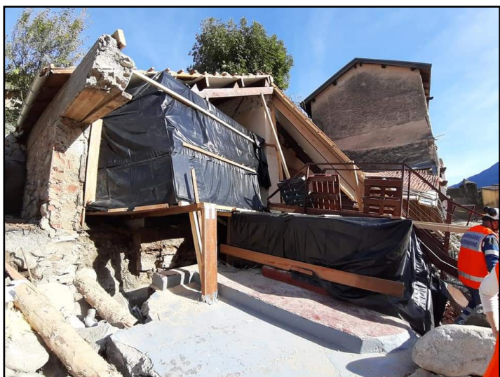
Musée du Patrimoine du Haut Pays à Saint-Martin-de-Vésubie "après sauvegarde des biens existants"