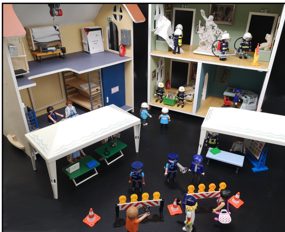
Intervention des pompiers et sauvetage des œuvres au mini musée Playmobil