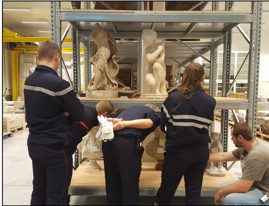
Formation sapeurs pompiers, Louvre Lens, 2019