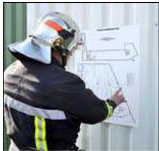
Les sapeurs pompiers au sein des musées © Musée Chagall. SDIS06.