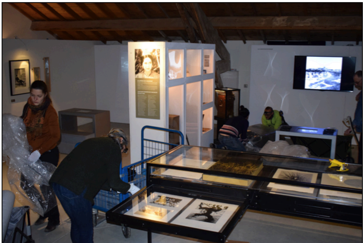
Emballage et évacuation des œuvres « Camargue secrète » (avant-plan) et du Stéréoscope (arrière-plan)

En 2018, grâce à l'accompagnement de l'association AVEC et l'aide des élèves de Polytech Marseille, l'équipe du Musée de la Camargue a pu finaliser son plan de sauvegarde et se former à l'évacuation des collections dans la zone refuge en cas d'inondation.