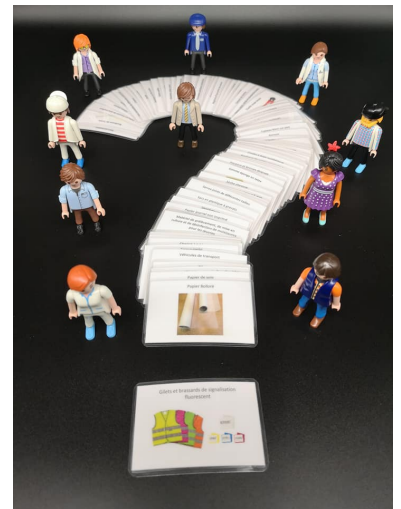
Comment établir la liste du matériel d'urgence d'un plan de sauvegarde ?