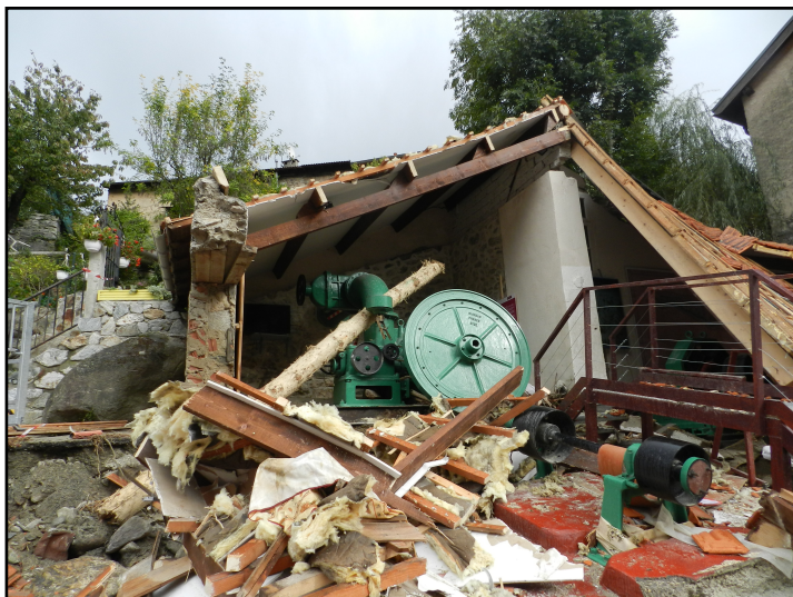
Musée du Patrimoine du Haut Pays à Saint-Martin-de-Vésubie "après la tempête Alex"

La tempête « Alex » qui s'est abattue le 2 octobre 2020 sur le Haut Pays Niçois a dévasté les vallées de la Roya, la Tinée, l'Estéron et la Vésubie, emportant habitations et infrastructures. Divers éléments patrimoniaux ont été impactés dont des monuments classés et des musées. Notre présentation s'efforcera de montrer comment s'est coordonnée la gestion de la crise, sous l'égide de la Direction régionale des affaires culturelles Provence-Alpes-Côte d'Azur et du Conseil départemental des Alpes-Maritimes. Elle mettra en évidence les actions qui ont pu être conduites et les difficultés spécifiques dues à isolement (destruction de voies de communication) dans un contexte de crise sanitaire. Elle illustrera quelques initiatives complémentaires de sauvegarde patrimoniale (de la haute montagne à la mer), visant à préparer la résilience du territoire. Au-delà, elle proposera des pistes de réflexion pour renforcer nos capacités collectives d'intervention afin d'anticiper l'augmentation de ce type d'aléas.