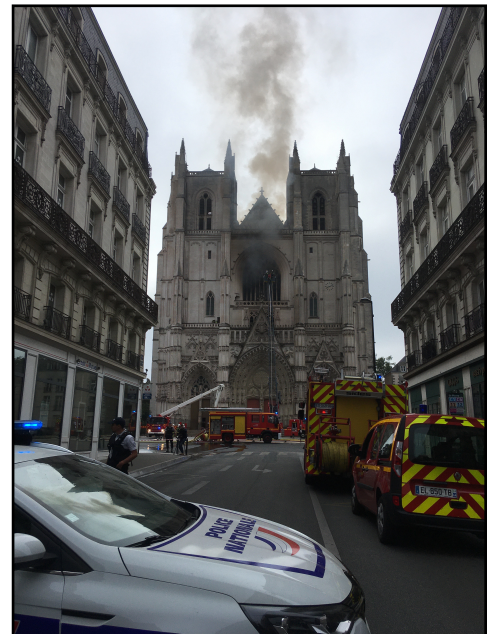
Incendie Cathédrale de Nantes, 18 juillet 2020

Si certains musées travaillent actuellement à leur PSBC ou l'ont déjà mis en place, le sujet n'est en vérité pas prioritaire dans de nombreux établissements et ce pour différentes raisons : manque de connaissance sur le sujet et de formations, charge de travail quotidienne déjà importante avec la difficulté à lancer un nouveau projet, manque de moyens humains et financiers, etc. À ce jour, il n'existe pas de recensement officiel du nombre de plan de sauvegarde établi dans le paysage patrimonial. Cette donnée en elle-même est très éclairante. Si la mise en place d'un plan de sauvegarde est fortement conseillée, voire appuyée, il en résulte qu'il ne s'agit pas d'une obligation. Un très grand nombre d'institutions n'ont de fait pas de plan établi ou formalisé, et ne peuvent répondre aussi justement qu'espéré aux préconisations du Ministère de la Culture.